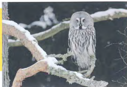
Lappuggla.