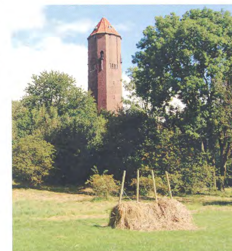
Örby ängar.

Vill du veta mer om Örby ängar så gå in och sök information på kommunens hemsida. Du hittar även information om Örby ängar som fågelokal på KOF:s hemsida. Det gör du genom att besöka www.kof.nu/lokaler/objekt/orby_angar.html