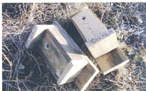
Resultat från Naturums familjedag.