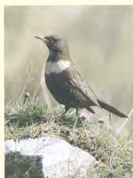
Omslag Ringtrast Alf Petersson

© Kullabygdens Ornitologiska Förening, 2013 ISSN 1104-3695