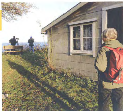
KOF-stugan.