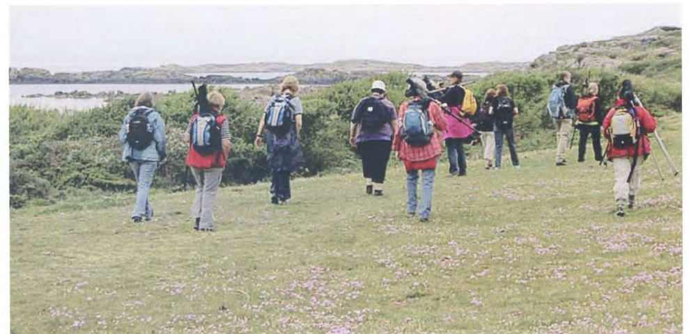
Tjejskådarexkursion med Rapphönan.