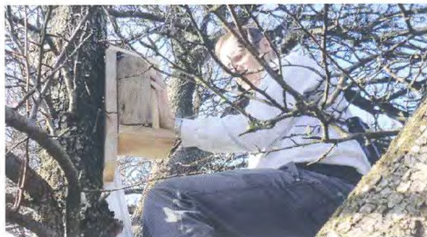
Ny bostad på Kullaberg.