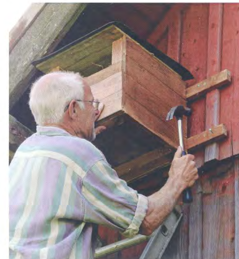
... och spikar i Döshult.