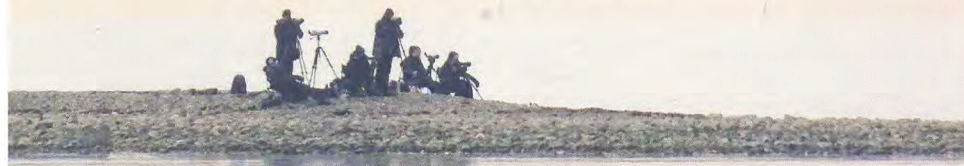
Hittarps rev.

En grov summering skulle i sportsammanhang kunna låta "Under en lång period väldigt defensivt och inte mycket kreativt. Med sydländska fläcktar och värme satte offensiven så småningom fart och vi bjöds på ett varierat utbud med flera toppar och flera ornitologer noterade goda insatser".