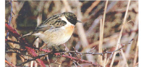
Gransångare (överst) och svarthakad buskskvätta.