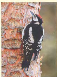
Omslag Större hackspett Mårten Müller

@ Kullabygdens Ornitologiska Förening, 2013 ISSN 1104-3695