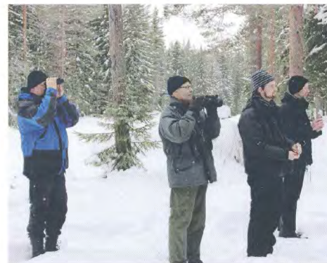
Delar av KOF:s styrelse i Gästrikland.

" - Det står något märkligt på Svalan. Det är en person som får besök av en lappuggla. Den kommer dagligen vid 15.30 och sätter sig i tallen ovanför lekstugan". Eftersom det bara innebar en omväg på ett par mil bestämde vi oss för att kolla upp rapporten. När vi närmade oss adressen kunde vi konstatera att; (1) där är huset; (2) där är lekstugan; (3) där är tallen och (4) där är lappugglan. Uppgiften på Svalan stämde och vi fick fina obsar på en lite yrvaken lappuggla som då och då spände de stränga gula ögonen i oss. En otroligt vacker upplevelse som gjorde att vi kunde förlåta slagugglorna som inte ville visa upp sig för oss.