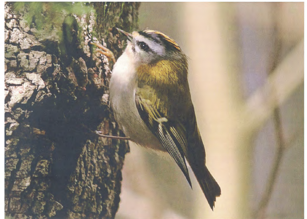
Brandkronad kungsfågel.