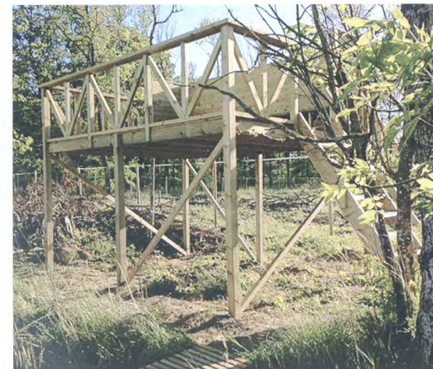
Nya plattformen vid Stureholms våtmark.