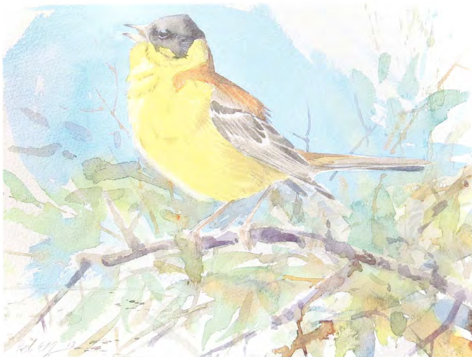
Svarthuvad sparv på Kullaberg, 6/6 2013. Illustration: Peter Elfman

Väl nere på de öppna markerna fotade jag eleganta törnskator och gick långsamt fram längs stigen. Jag hörde då en skum fågelsång nere ifrån Åkersberget, en sång jag inte riktigt kände igen. Tänkte på stenskvätta, svart rödstjärt m.m. Gick ner mot havet på den smala stigen i slutningen, sången hördes igen, jag skannade klipporna med kikaren, gick några meter tills jag kom fram till öppen sikt över ravinen och plötsligt flög något gult upp! Fågeln satte sig ca 5 m bort. Jag fick upp kikaren och såg direkt att det var en svarthuvad sparv. Pulsen gick i topp, jag försökte ta några hysfada bilder. Insåg att täckningen var kass på