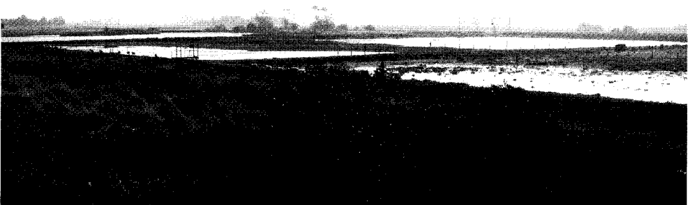
Hasslarps sockerbruksdammar, oktober 2001.

Av Figur 1 och Tabell 2 framgår att andelen rörsångare av den totala fångsten successivt har ökat sedan starten 1996. Vad som ligger bakom ökningen är inte klart men kan delvis bero på att nätplatserna har ändrats under åren och därmed gynnat rörsångarna. Sävsångarens andel av fångsten har däremot varit relativt konstant.